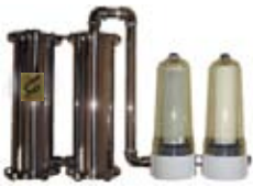
愛と調和の水「アムリタ」

です。どんなに良いシャンプーやトリートメントを使用しても、塩素や化学物質が含まれた水道水で洗ってしまったら意味がありません。しかしこの「アムリタ」