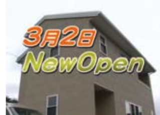
美容室「天使のはしご」

この美容室、「フワア」とした心地よい「気」が流れており、とっても居心地が良いんです! 今回はこの素敵な美容室を皆様に紹介したいと思えます。